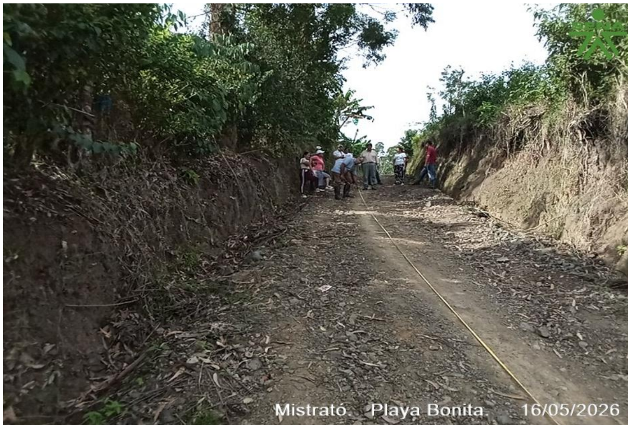
Mistrató. Playa Bonita. 16/05/2026