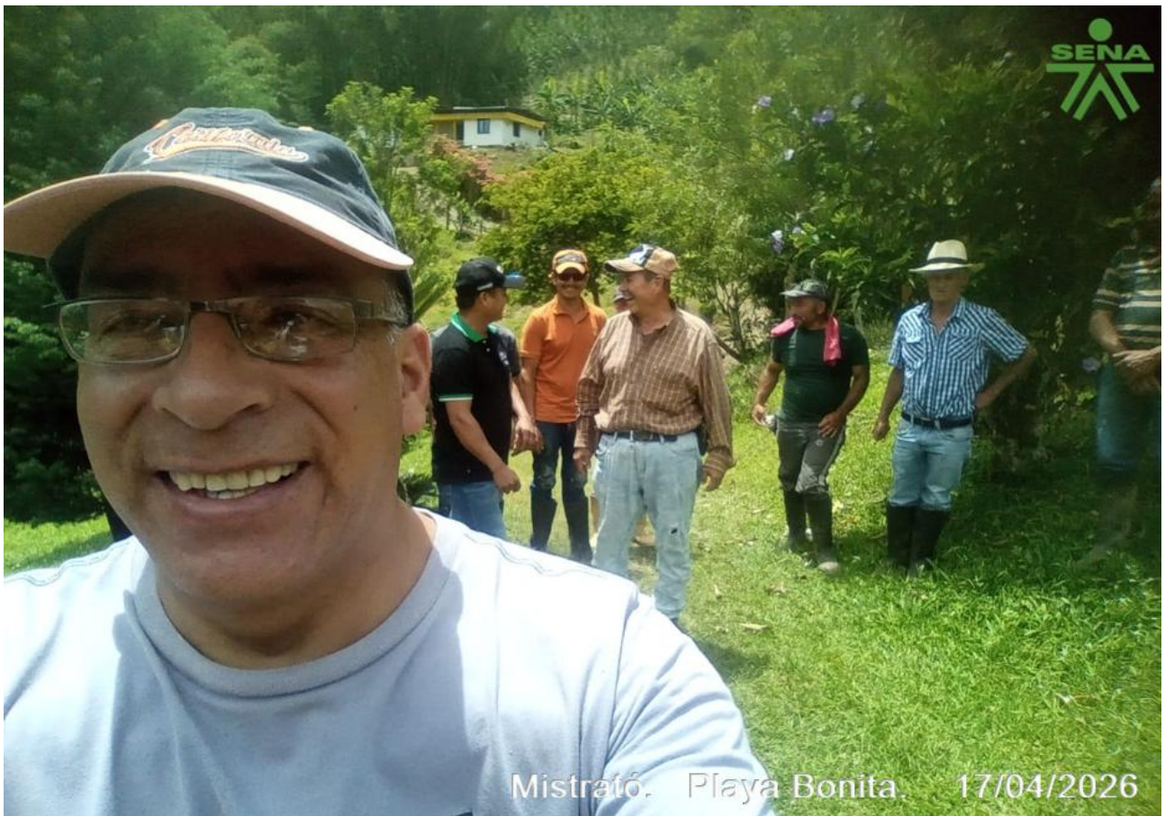
Mistrató. Playa Bonita. 17/04/2026