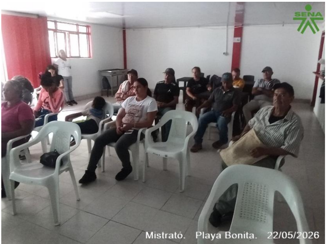
Mistrató. Playa Bonita. 22/05/2026