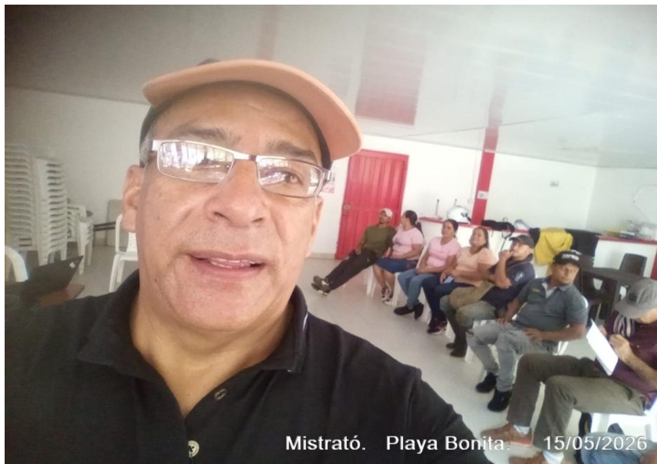
Mistrató. Playa Bonita. 15/05/2026