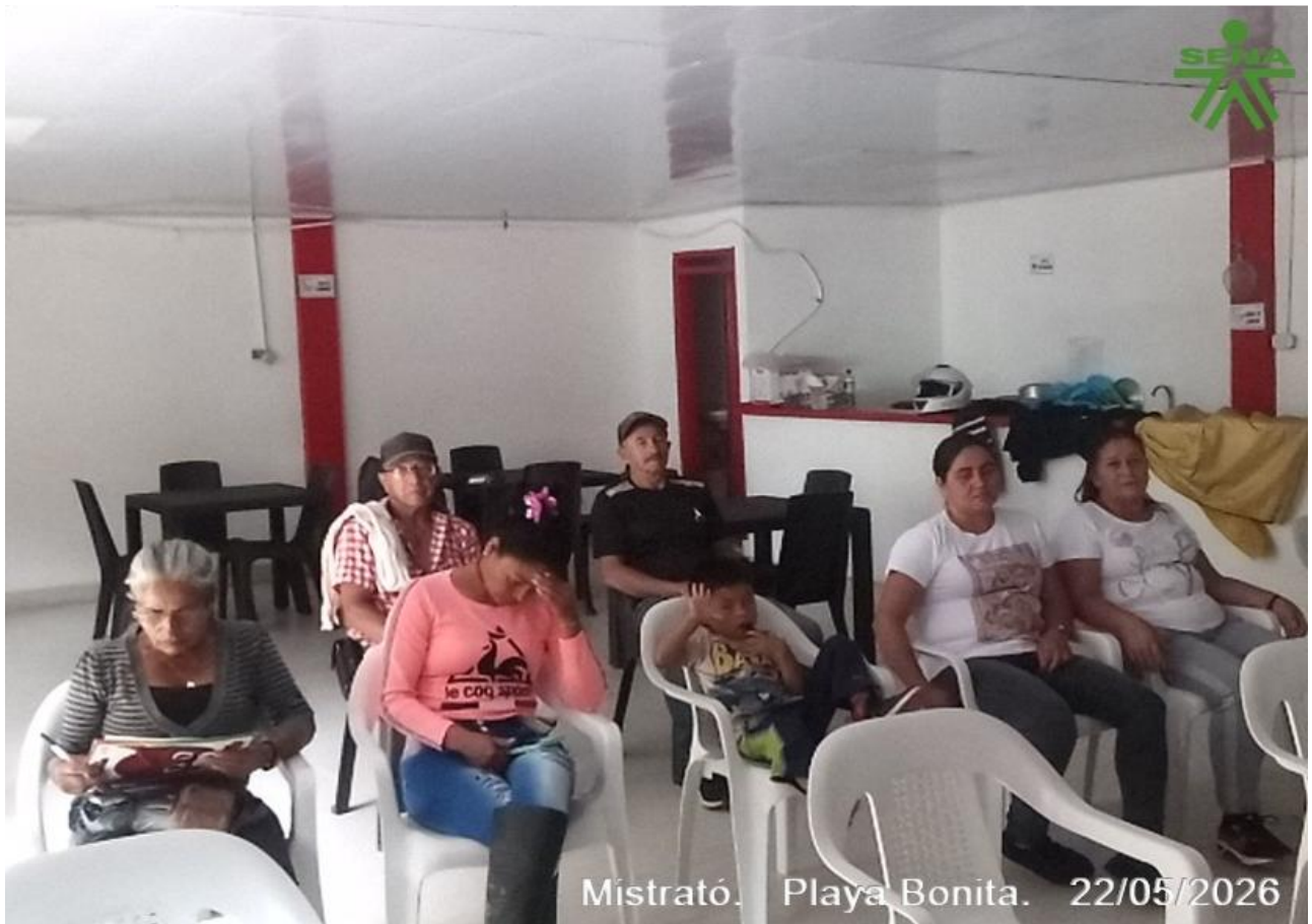
Mistrató. Playa Bonita. 22/05/2026