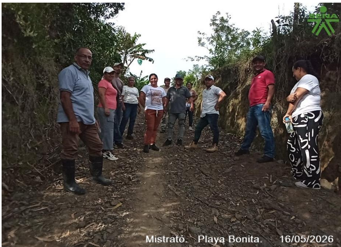
Mistrató. Playa Bonita. 16/05/2026