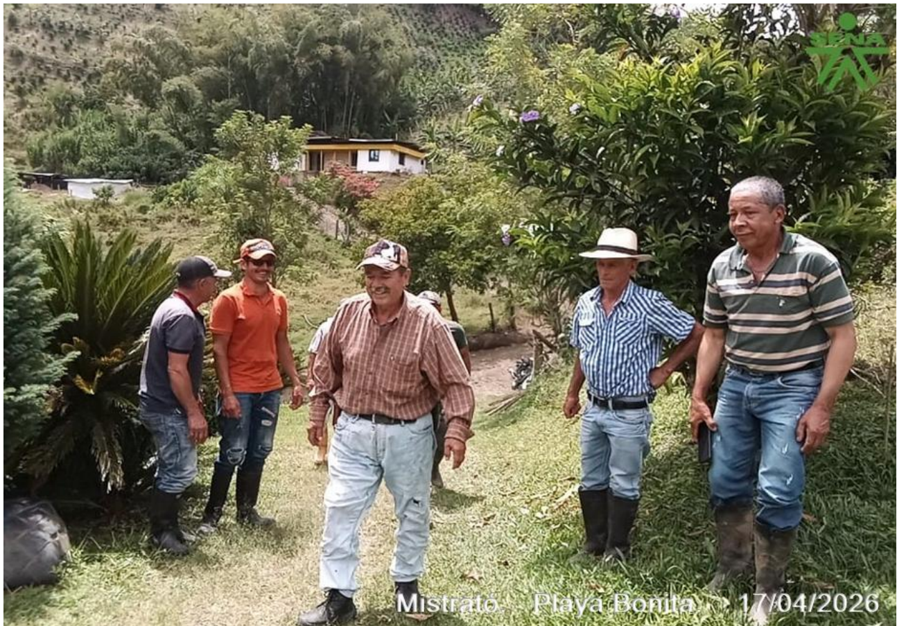
Mistrató. Playa Bonita. 17/04/2026