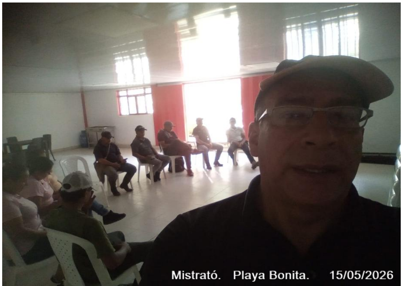
Mistrató. Playa Bonita. 15/05/2026