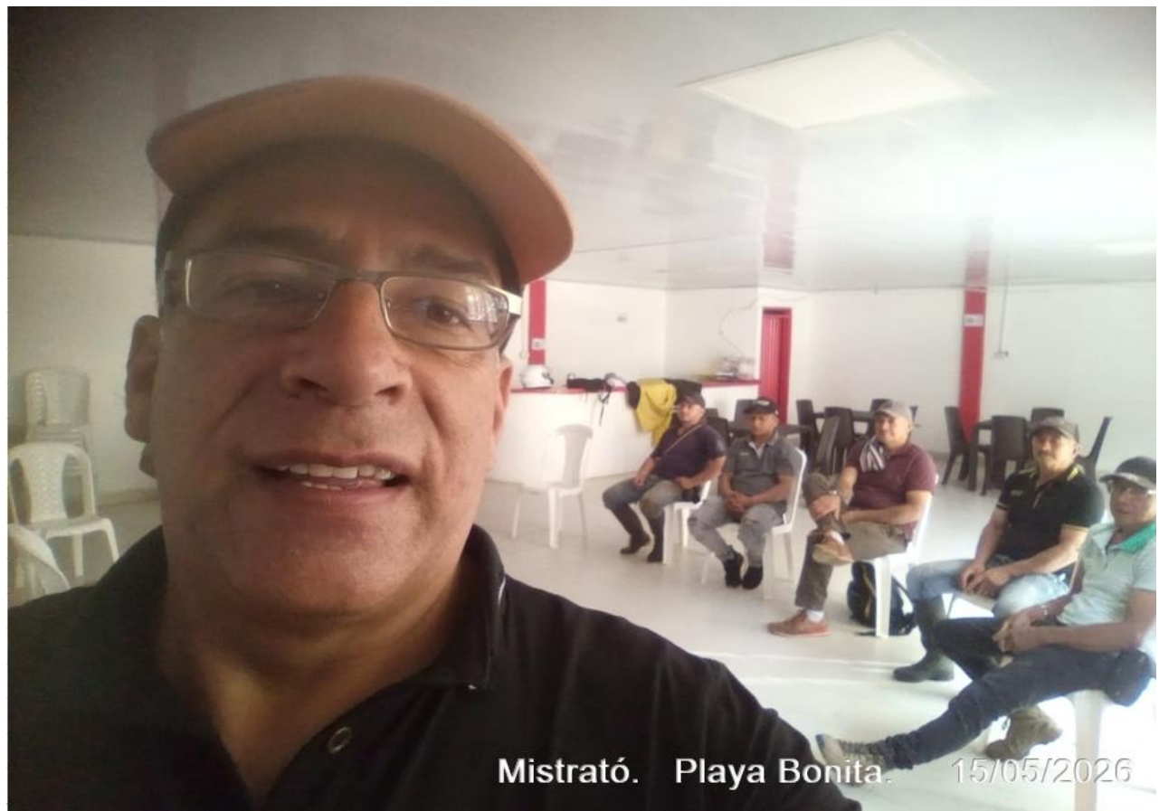
Mistrató. Playa Bonita. 15/05/2026