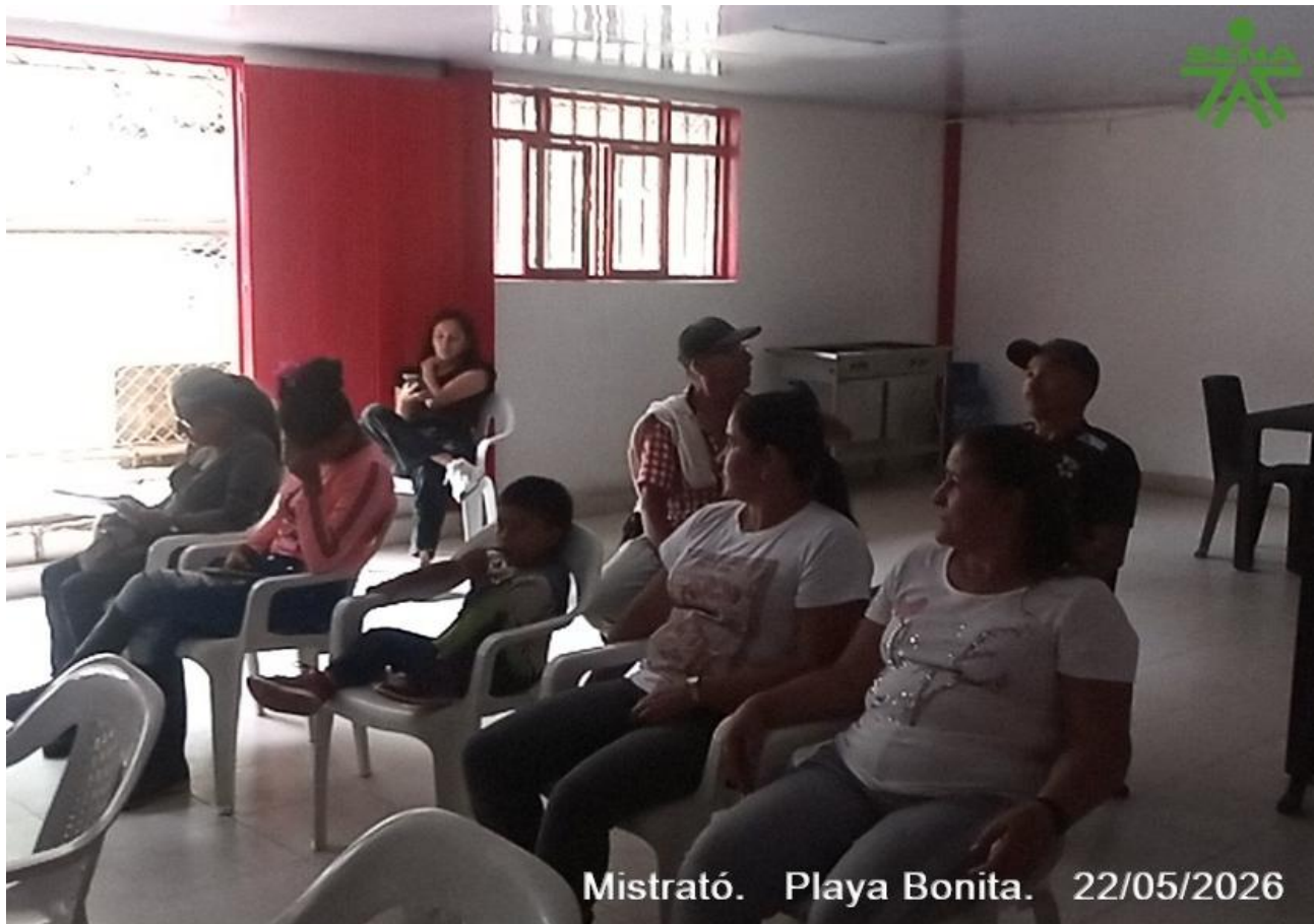
Mistrató. Playa Bonita. 22/05/2026