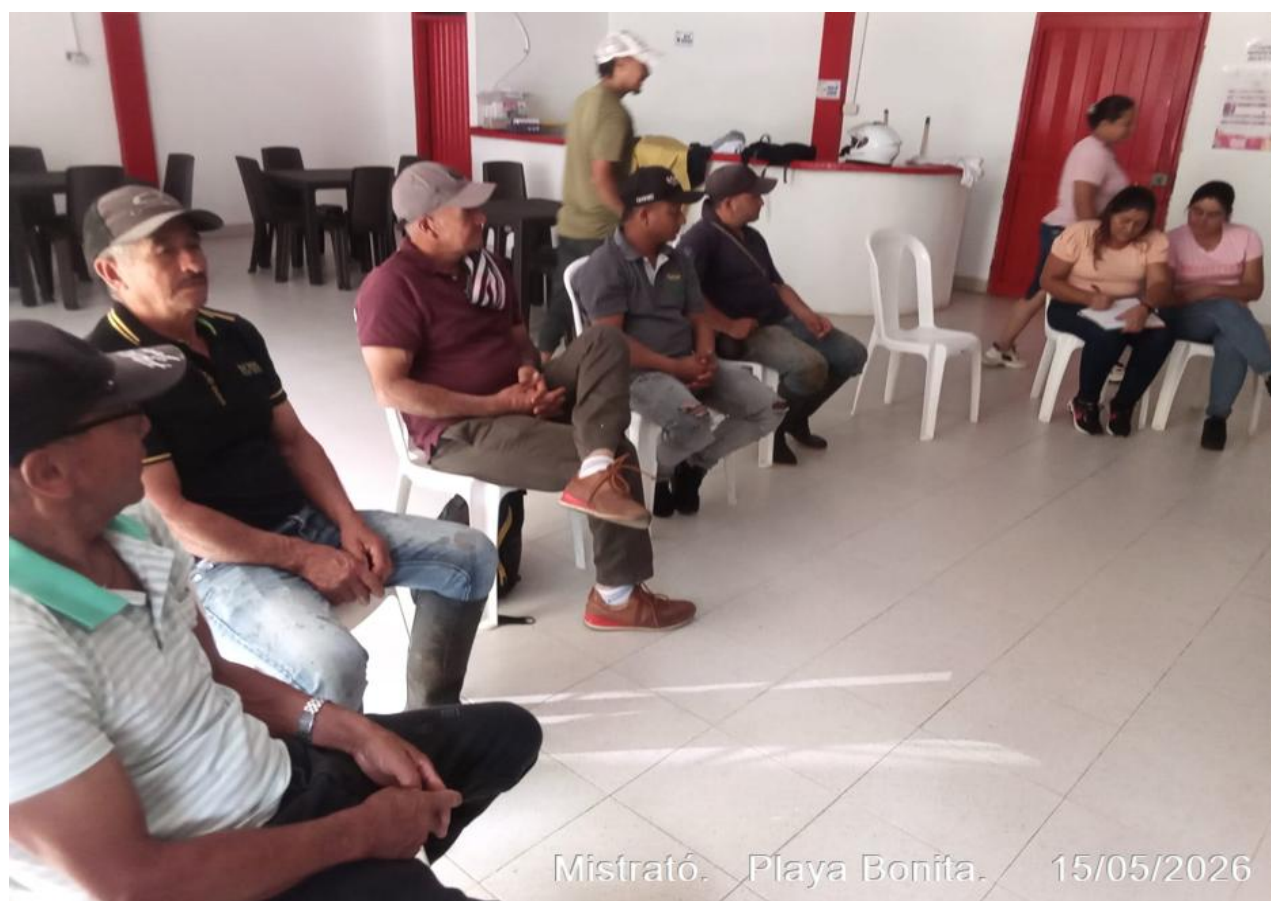
Mistrató. Playa Bonita. 15/05/2026